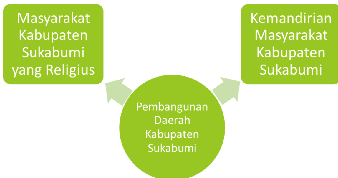
Gambar Hubungan Antar Elemen Visi Pembangunan Kabupaten Sukabumi

Visi tersebut mengandung dua elemen penting dalam capaian pembangunan Kabupaten Sukabumi periode 2016-2021 yakni religius dan mandiri. Dari dua elemen tersebut maka dapat ditelaah bahwa kepala daerah ingin membangun Kabupaten Sukabumi menjadi sejahtera dengan tetap mempertahankan moral religiusitas dan kemandirian masyarakat seperti yang tergambar pada gambar berikut.